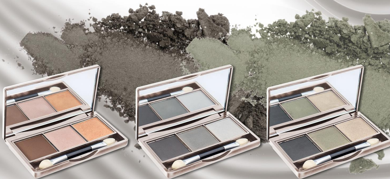
Odstín 01 – Romantic Cocktail